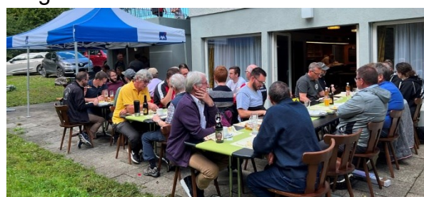
Man fühlte sich wohl in Seen-Gotzenwil.

Wäre noch eine Goldmedaille zu vergeben gewesen, so hätte diese zu Recht an die Kolleginnen und Kollegen der Gastgeber vergeben werden müssen!