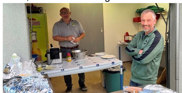
Sie hatten ihren Job im Griff: Die Kollegen am Grill und im Service!

Keiner wusste, wie oft der Kantonalfinal schon in Seen-Gotzenwil zu Gast war. Aber jede und jeder bestätigte, dass die Gastgeber einmal mehr hervorragende Arbeit geleistet hatten. Im schiesstechnischen Bereich liessen sie keine Wünsche offen und das Wort «Gastgeber» nahmen sie wörtlich und verwöhnten die Gäste mit allem, was das Herz begehrt.