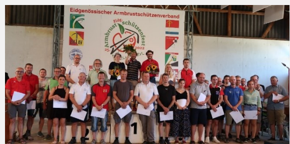
Die Teilnehmer des Finalwettkampfes.