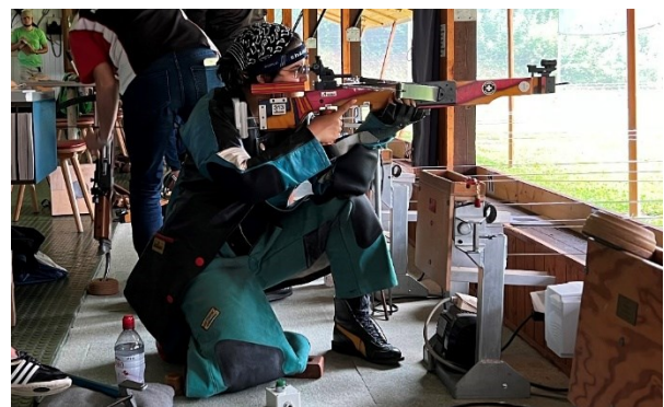
Jeder Punkt zählt.