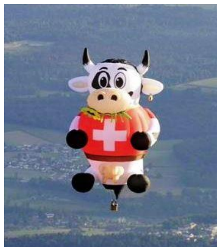
Der Schweizer Spionage-Ballon