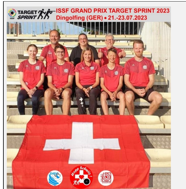
Das Swiss Target Sprint Team in Dingolfing (GER):